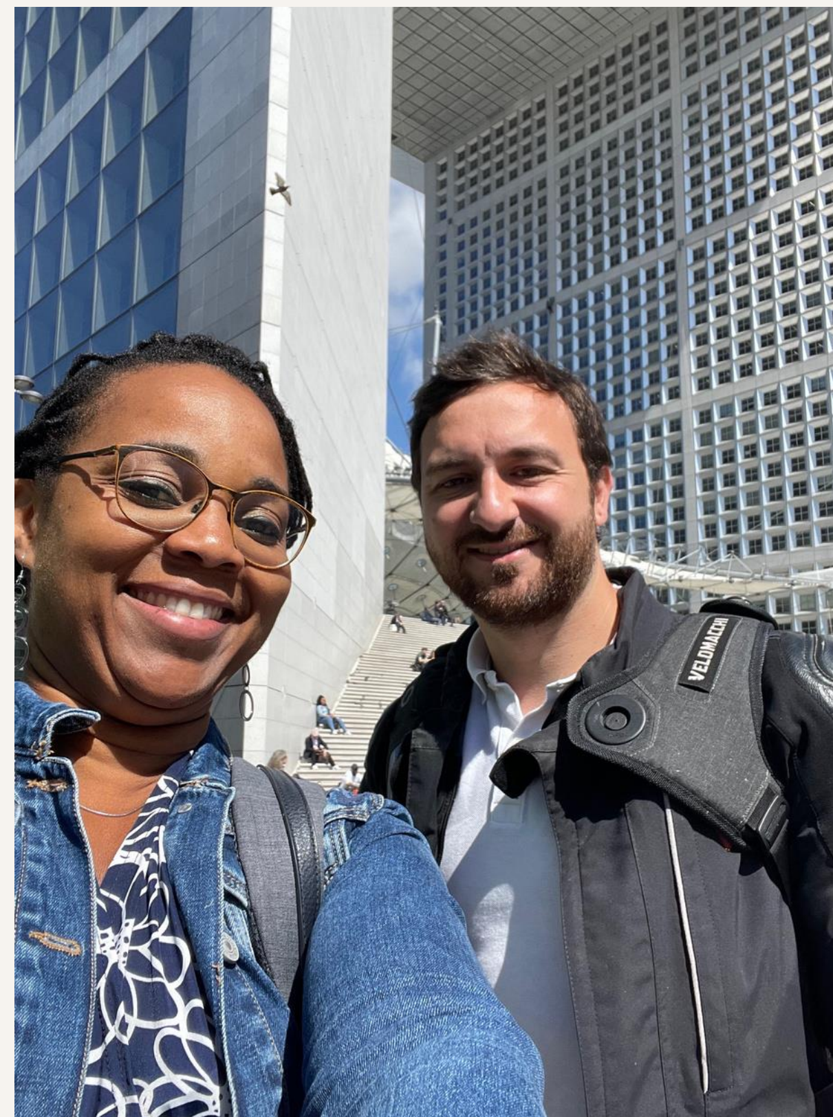
# LONAEH TEAM